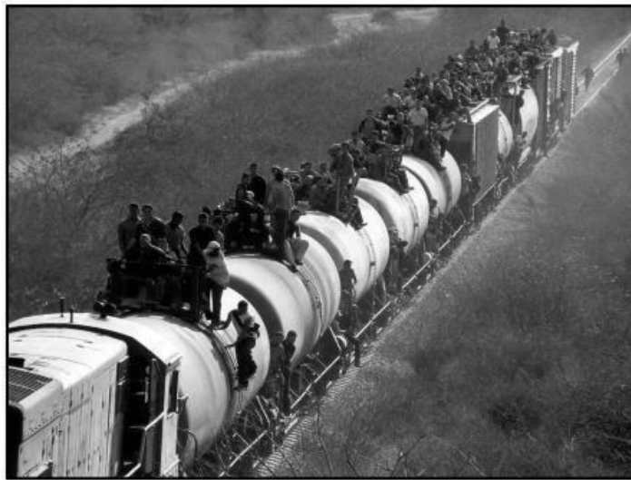
MIGRANTES LATINOAMERICANOS RUMBO A ESTADOS UNIDOS

El o la Intérprete no debe describir imágenes, pero sí interpretar los textos que acompañan a dichas imágenes; las imágenes también pueden figurar en la Prueba de Historia y Ciencias Sociales, como se muestra a continuación: