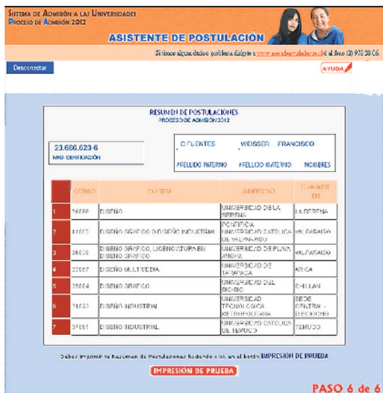
Figura N° 23

Este año, por primera vez, en el Modo Oficial -4 a 6 de enero de 2012- se podrán hacer hasta dos (2) anulaciones de postulación, tras lo cual deberás seleccionar nuevamente tus preferencias.