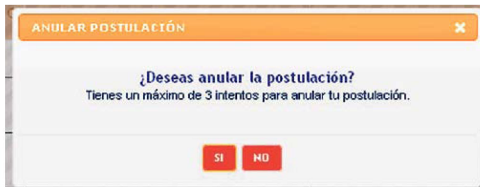
Figura N° 26

Se podrá efectuar la anulación de la postulación en la medida que no se supere los intentos permitidos y se encuentre dentro del plazo establecido, entre el 4 y 6 de enero de 2012.