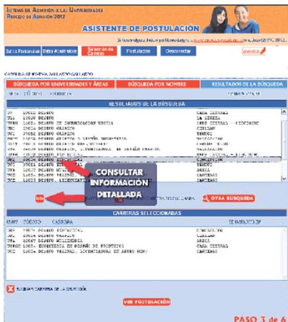
Figura N° 17

Y luego hacer click en el ícono para obtener la información requerida.