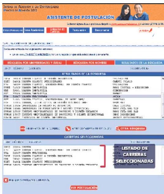
Figura N° 16

Finalmente, debes presionar el botón VER POSTULACIÓN para visualizar y, posteriormente, confirmar tu postulación transformándola en definitiva (Paso 4).