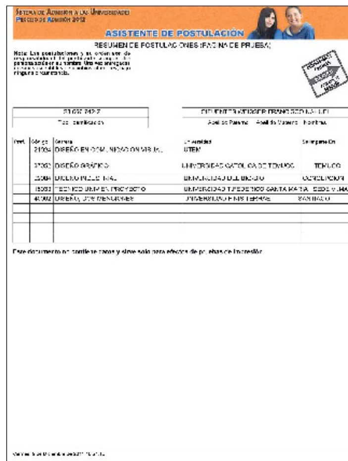
Figura N° 24

Se abrirá un documento en formato PDF (Figura N° 24) con la misma información indicada en la Figura N° 23. Este archivo deberás imprimirlo y conservarlo, tal como se indicó previamente.