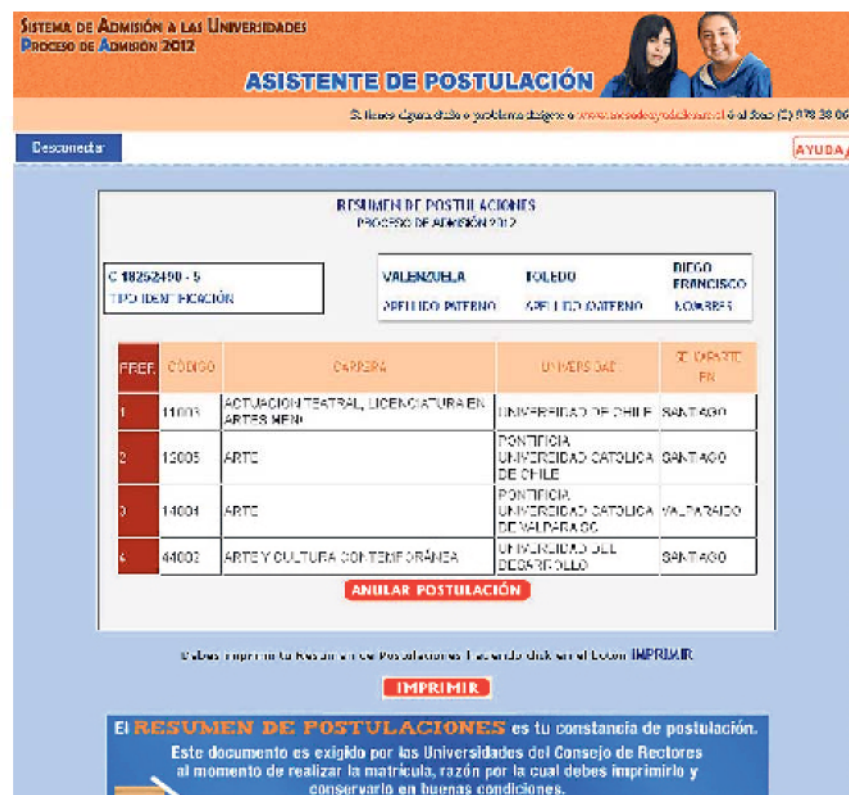
Figura N° 25

El sistema permite, en este nivel de la postulación, anular la selección de carreras y comenzar nuevamente todo el proceso. SE PODRÁ EFECTUAR UN MÁXIMO DE 2 (DOS) ANULACIONES DE POSTULACIÓN.