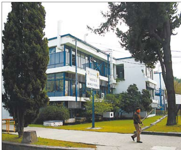
La facultad se encuentra a la vanguardia en materia de investigación.

La facultad se encuentra a la vanguardia en materia de investigación, a través del desarrollo de 57 líneas de investigación específicas. Actualmente, ejecuta más de 75 proyectos con financiamiento obtenido vía concursos nacionales,