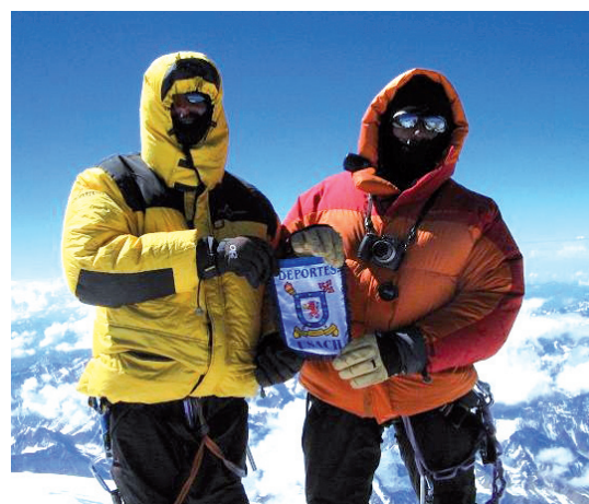
Los alumnos de Usach se han destacado en las diferentes disciplinas deportivas en donde han participado.