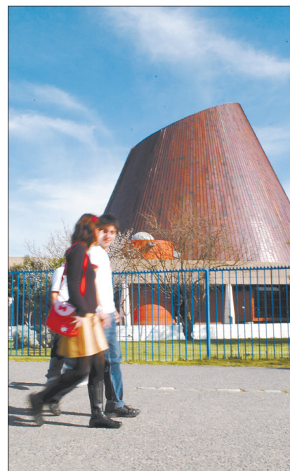
El proyecto educativo busca reforzar su excelencia.

alternativas de formación continua. El concepto de empleabilidad no solamente se refiere a la capacidad de emplearse, sino muy especialmente en la capacidad de transformarse en agentes desarrolladores de empleo. A través de los programas de educación continua y posgrados, la universidad acompaña a sus profesionales a lo largo de la vida ya que, en la actualidad, es ineludible la necesidad de incorporar nuevos conocimientos que les permitan mantener su calidad y vigencia en el medio laboral. El proyecto educativo de Usach es la piedra angular sobre la cual se sustenta el proceso de renovación curricular que está impulsando, y que busca mantener el nivel de excelencia que esta casa de estudios ha desarrollado en sus 156 años.