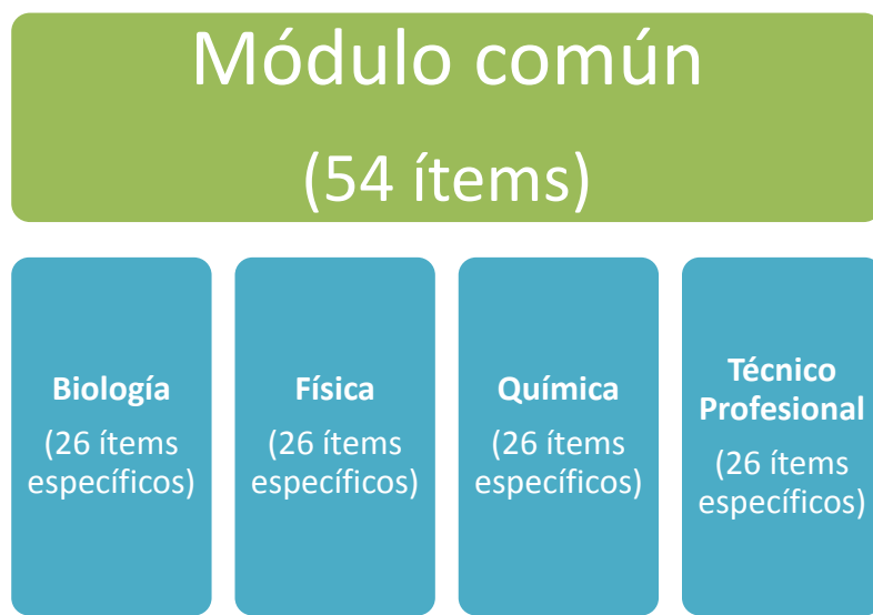
Ilustración 2. Representación de los grupos que rinden la Prueba de Ciencias y los ítems a responder

En el modelo, se busca establecer las equivalencias de los puntajes de los módulos optativos condicionándolos a los rendimientos en el módulo común. En este procedimiento, el puntaje final de la prueba de Ciencias es la suma del puntaje del módulo común (que no requiere transformación), más el del módulo optativo ajustado. Para aplicar el método, se elige uno de los módulos como referencia, en cuyo caso, los puntajes de los que rinden dicho módulo no son modificados por el alineamiento de puntajes. Para el alineamiento de la Prueba de Ciencias del proceso 2018, se utilizó como grupo basal a quienes rindieron la prueba de Biología.